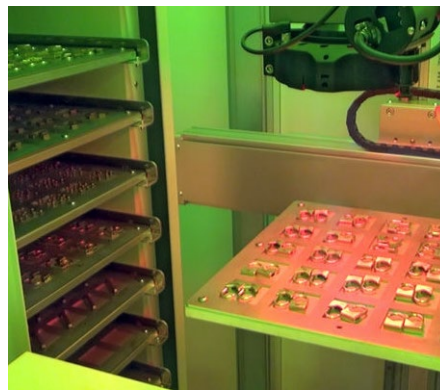
Rôzne objekty na každej palete Lavorazione di oggetti diversi su ogni pallet