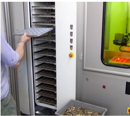
Nakladanie/vykladanie počas prevádzky Carico e scarico durante il funzionamento

Sistema di Visione Coassiale (CVS) integrato per la centratura precisa e il riconoscimento automatico dei pezzi, interfaccia di controllo che permette la gestione delle lavorazioni su ogni singolo pallet (anche durante il funzionamento).